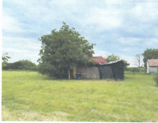
Pogled na KP 3390 KO Zrenjanin III i metalni kiosk