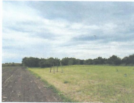
Pogled na objekat br. 1 na KP 3390 KO Zrenjanin III